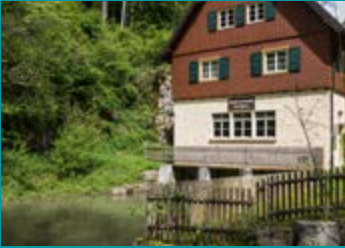
Wasserkraftwerk im Lautertal